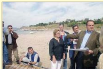
Από την επίσκεψη του πρωθυπουργού το Μάη 2004, στην ακτή της Βούλας, όταν εξήγγειλε την ανάπησή της.

- Παραλία εγκαινιάστηκε εν όψει των παραολυμπιακών αγώνων της Αθήνας το 2004 από εκπρόσωπο του Πρωθυπουργού την Κ. Καραμανλή Νατάσσα παρουσία του Κ. Αβραμόπουλου Δημήτρη και Κακλαμάνη Νικήτα επί προεδρίας στο ΚΑΑΠ-Βούλας της Κ. Τζοχαντζοπούλου Αρετής.