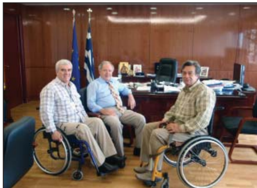
Ο πρόεδρος της ΕΟΚΑ Σκόννης Νικόλαος με τον Α' Αντιπρόεδρο Μούσιο Γρηγόρη κατά την συνάντηση με τον Αναπληρωτή Υπουργό Εσωτερικών υπεύθυνο για θέματα Δημοσίας τάξεως κ. Χρήστο Μαργκογιαννάκη.

Η Ε.Ο.Κ.Α έχοντας πλήθος καταγγελιών και δημοσιευμάτων, έκανε συνάντηση με τον