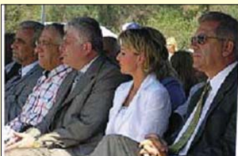
Από τα εγκαίνια.

- Με συνεχείς προσπάθειες η παραλία άνοιξε και το καλοκαίρι του 2009 χωρίς να έχει να ζητήσει τίποτα από τις οργανωμένες παραλίες. Η διοίκηση του ΚΑΑΠ-Β μας υπόσχεται ακόμα καλύτερη την παραλία το 2010.