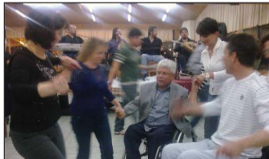
Από τη γιορτή.