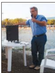
Ο Δήμαρχος Ελληνικού στα εγκαίνια.

Αξιέπαινη η προσπάθεια όλων των συντελεστών για την κατοχύρωση και διαμόρφωση της παραλίας του Ελληνικού, άλλη μια παραλία προσβάσιμη για ΑΜΕΑ προστίθεται στις Ανατολικές ακτές της Αττικής.