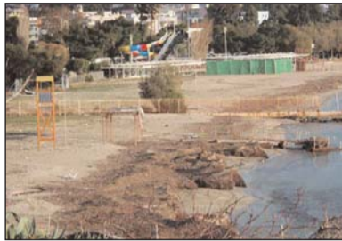
Φαίνεται η βυθισμένη εξέδρα όπως στα μέσα του χειμώνα (2009) την είχαμε δει.

Εκεί προσαρμόζονται τα αναβατόρια εισόδου - εξόδου στη θάλασσα