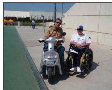
Ο Πρόεδρος της ΕΟΚΑ με την αθλήτρια στα εκατό ανδρών.