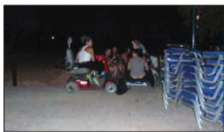
Παρέα νέων απολαμβάνουν σε «πηγοδάκι» την Πανσέληνο.