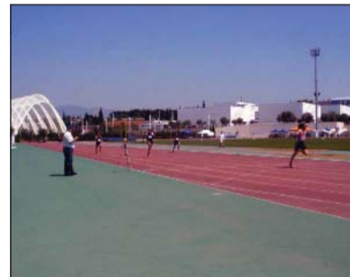
Εντυπωσιακός τερματισμός Ειρήνη Σταυρακάκη.