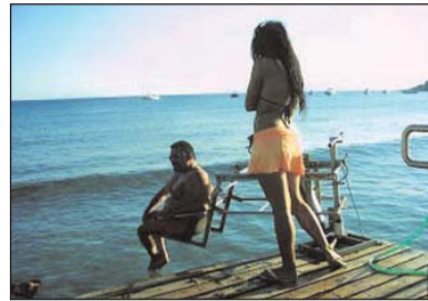
Το αναβατόριο .

δυναμιά να απολαύσουν με άλλο τρόπο το αγαθό του νερού, είναι το σημείο