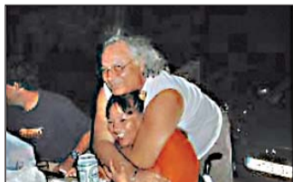
Η ρομαντική βραδιά τους έφερε κοντά...

Υπέροχη βραδιά που την ακολούθησε φαγοπότι ρεφενέ, δεν μοιάζει κανένας να είναι σαν κρέας στοιβαγμένος, ούτε δυστυχής.....παρά την δωδεκάτη νυκτερινή.