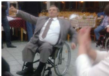
Το Ζεϊμπέκικο της καρδιάς !!!