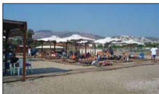
Οι ηλούμενοι στην ΠΙΚ-ΠΛΑΖ.